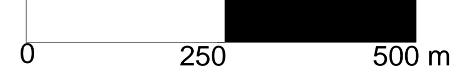
Zoom 2 au 1 / 2 500 ème de la zone du centre ville