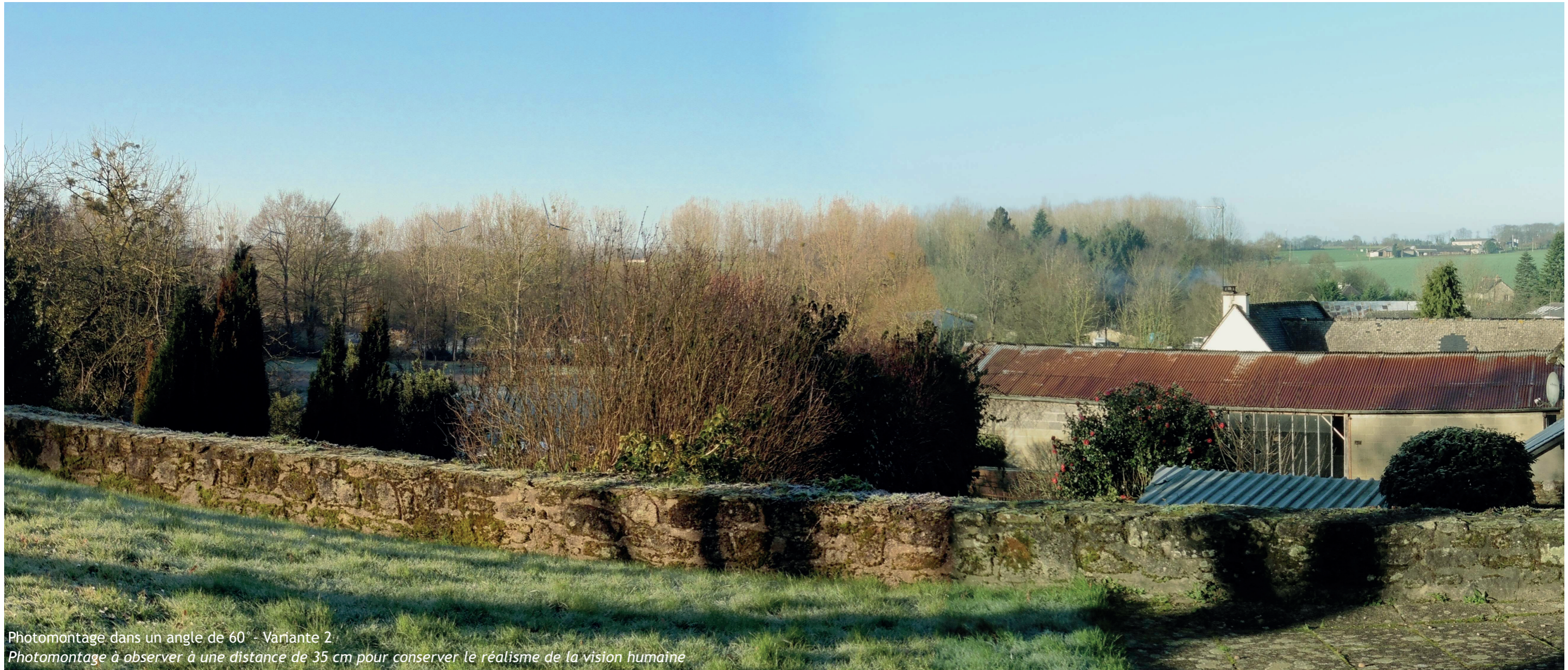
Photomontage dans un angle de 60° - Variante 2 Photomontage à observer à une distance de 35 cm pour conserver le réalisme de la vision humaine