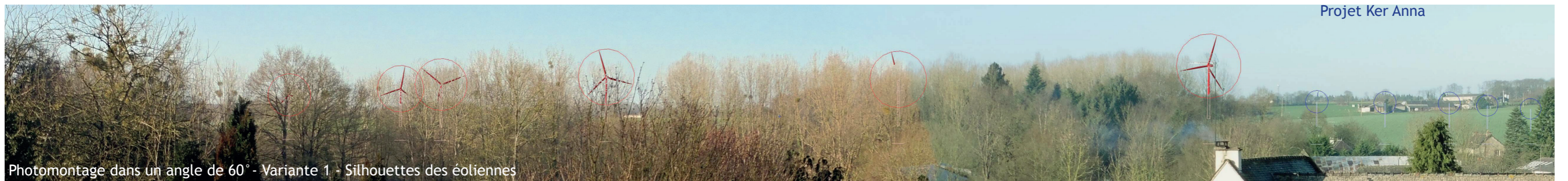
Photomontage dans un angle de 60° - Variante 1 - Silhouettes des éoliennes