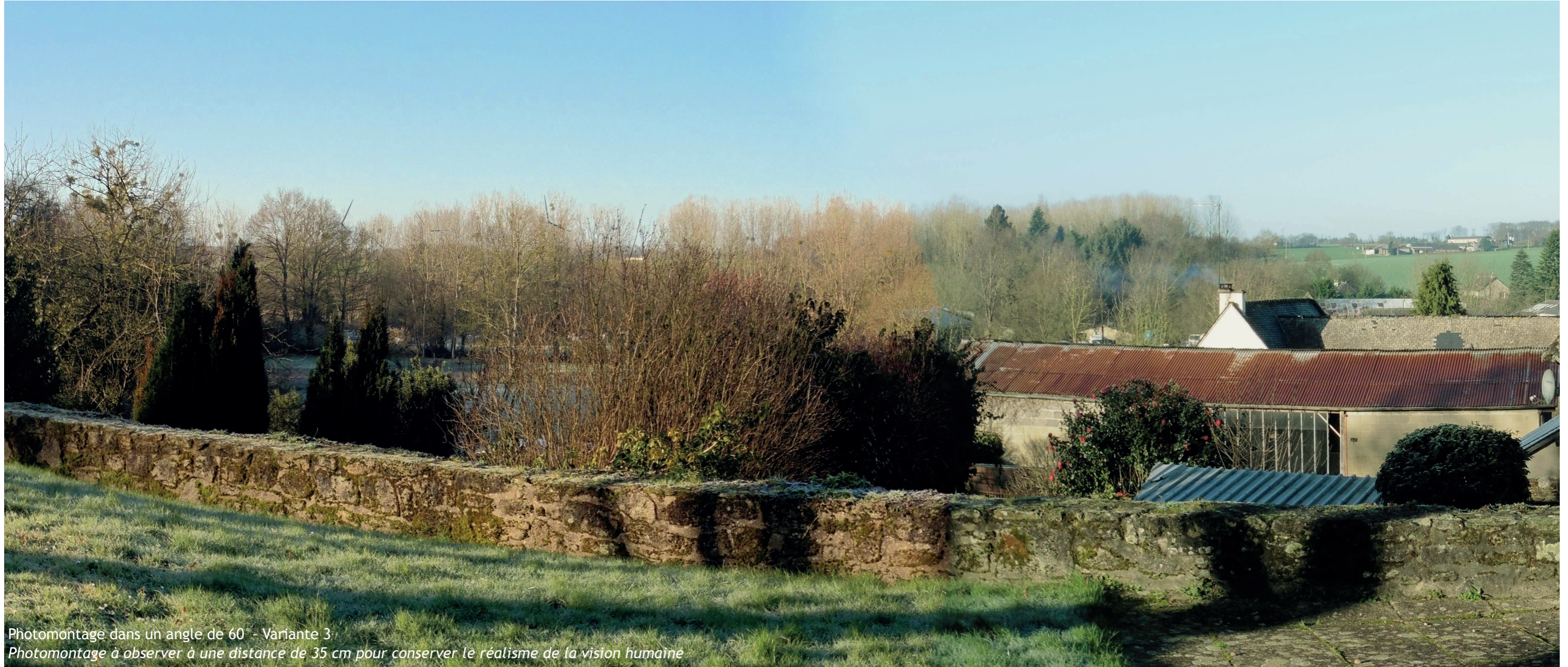
Photomontage dans un angle de 60° - Variante 3 Photomontage à observer à une distance de 35 cm pour conserver le réalisme de la vision humaine