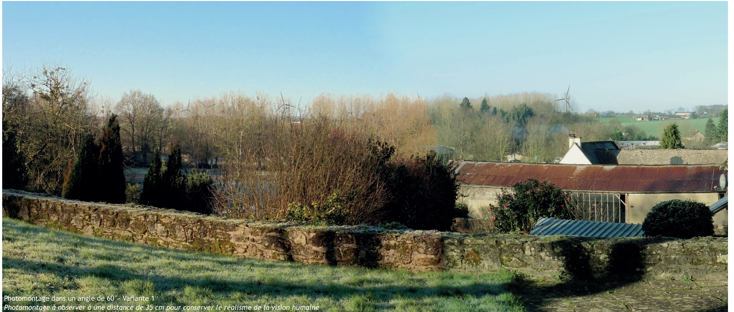
Photomontage dans un angle de 60° - Variante 1 Photomontage à observer à une distance de 35 cm pour conserver le réalisme de la vision humaine