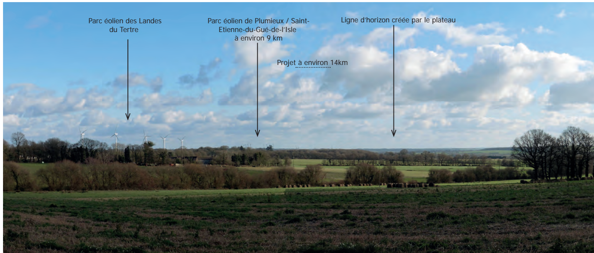
Photomontage 42 depuis Loudéac près de la N164

Les vues lointaines depuis le Nord et l'Ouest sur le plateau de l'Yvel