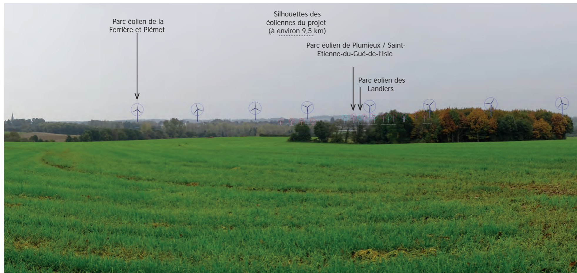
Photomontage 47 depuis le plateau au Nord de Plémet - Silhouettes des éoliennes (projet en rouge), projet non visible

Le projet se lit sur la ligne d'horizon créée par le plateau (pales, portions de pales), avec les autres parcs éoliens dont celui de Plumieux / Saint-Etienne-du-Gué-de-l'Isle . L'emprise du projet est faible et la distance induit des éoliennes peu prégnantes .