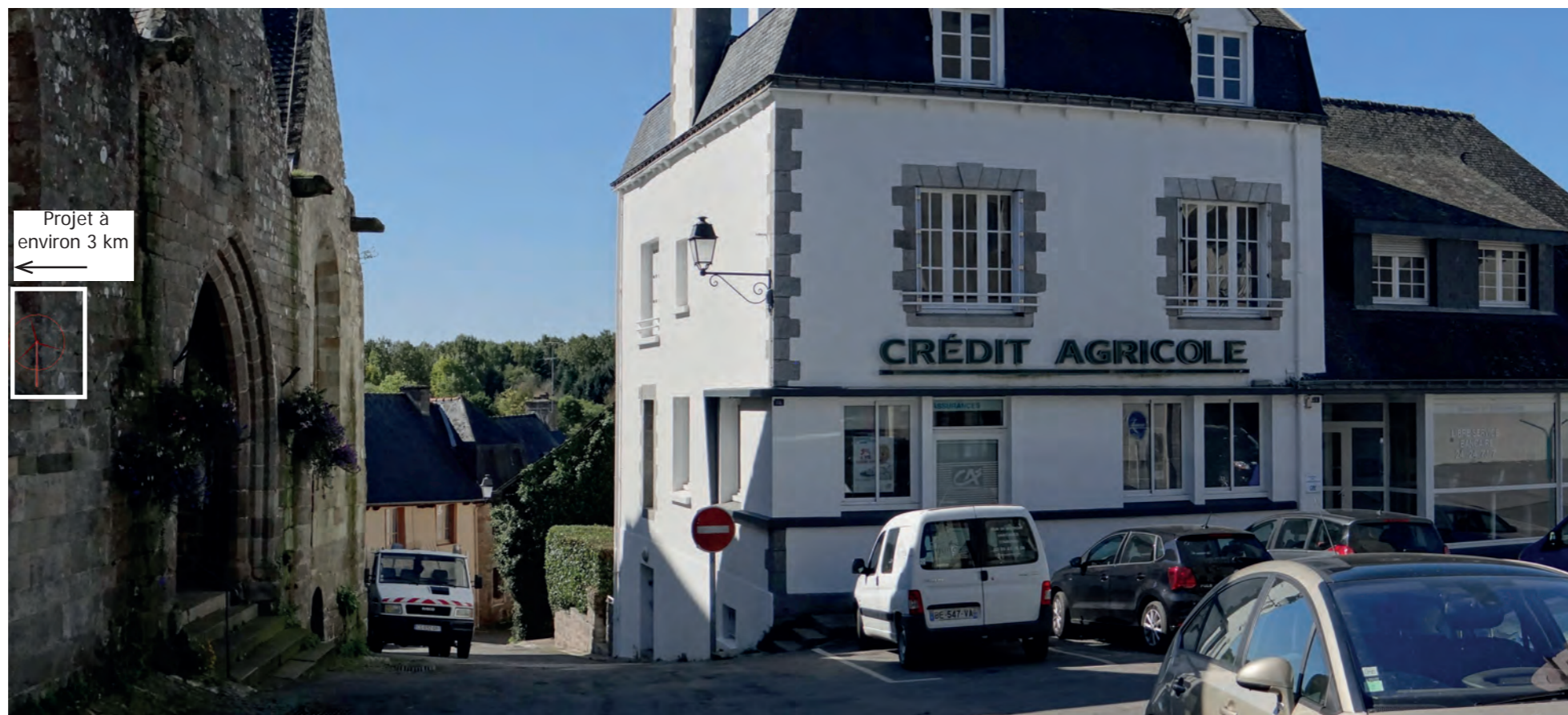
Photomontage 25, Eglise de La Trinité-Porhoët