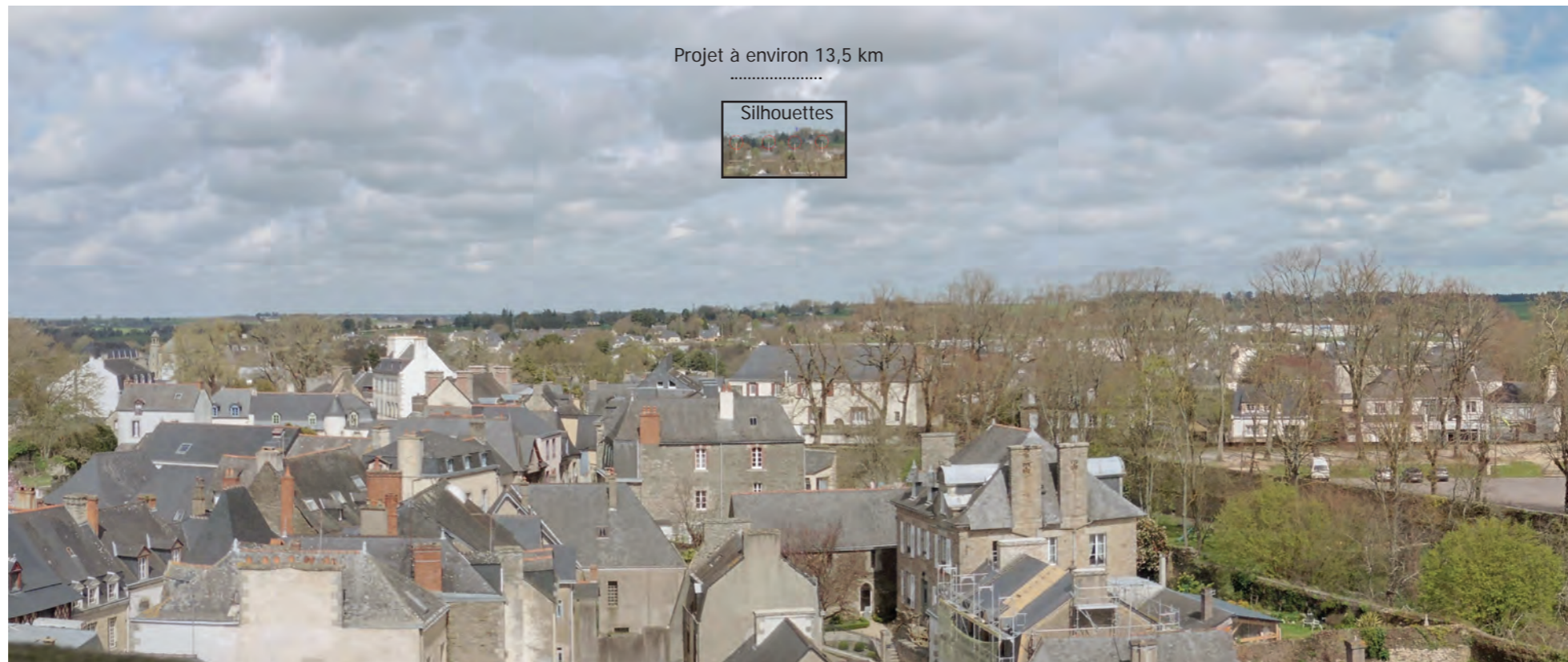
Photomontage 38 depuis le haut du clocher de la cathédrale de Josselin - Silhouettes des éoliennes