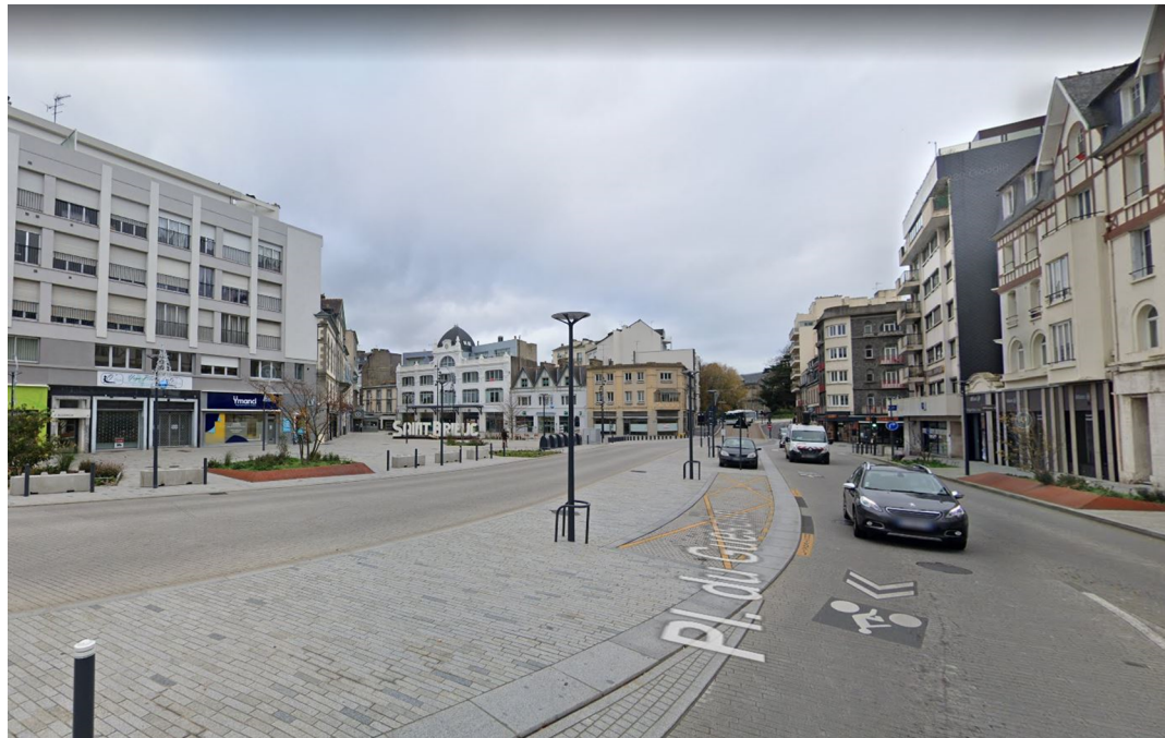
Figure 2 : Place du Guesclin

L'Autorité environnementale n'a émis aucune observation pour la phase 2 de TEO dans un courrier en date du 5 septembre 2017. Elle a fait l'objet d'une déclaration d'utilité publique en date du 25 avril 2018.