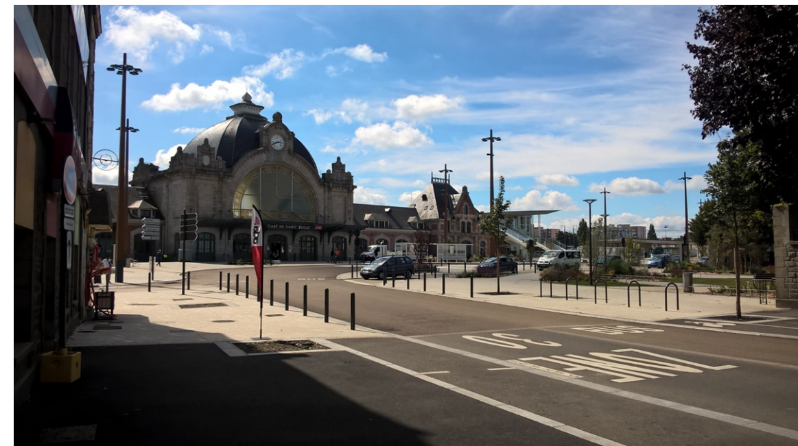
Figure 4 : Le nouveau parvis de la Gare SNCF de Saint-Brieuc