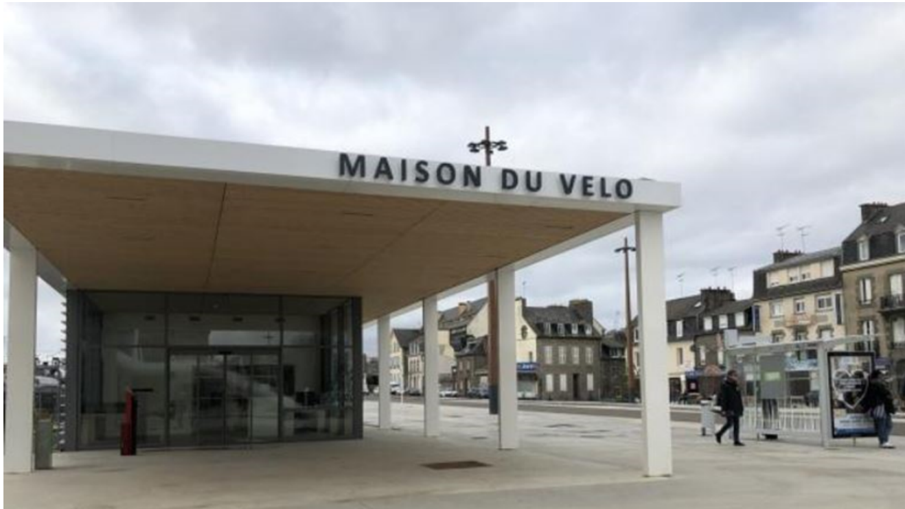
Figure 5 : La Maison du vélo

La création de la maison du vélo aux abords de la gare (inaugurée en janvier 2020) ajoute une dimension mode doux plus prégnante dans les usages et l'image des nouveaux aménagements.