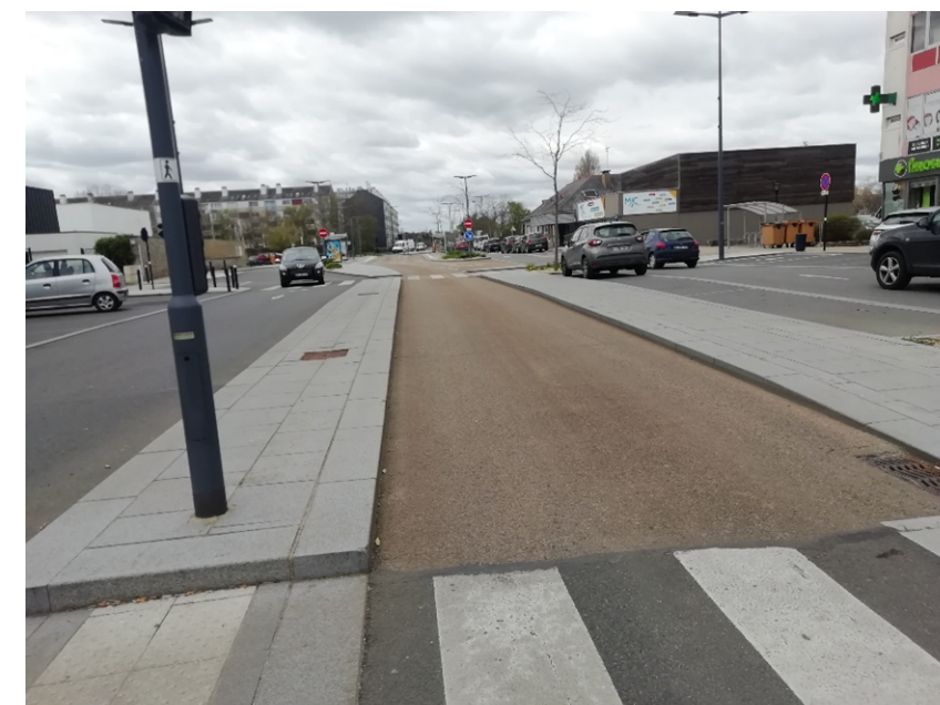
Figure 1 : La Place de la Cité aménagée lors de la phase TEO 1 (Source : EGIS, Avril 2021))

L'opération TEO a fait l'objet d'un avant-projet global qui aura permis de poser les bases du tracé, des stations et d'une programmation générale qui débouchera sur la réalisation d'un premier tronçon de BHNS livré en 2014 à l'Est de la commune de Saint-Brieuc entre la Place de la Cité (station Université) et le Pont d'Armor.