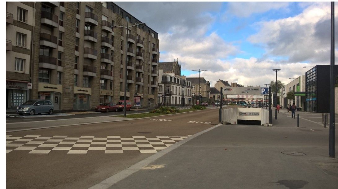
Figure 3 : Rue du 71 e Régiment d'Infanterie